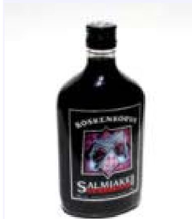
Salmiakki, der finnische "Lakritzschnaps"

In Finnland ist der sogenannte Salmiakki weit verbreitet und so etwas wie der Nationalschnaps. Die tiefschwarze Spirituose hat zwischen 30 und 40 vol% Alkohol und schmeckt intensiv nach Lakritz. Für Nicht-Kenner sehr gewöhnungsbedürftig, wird er von den meisten Einheimischen geliebt. Anlässlich der Olympischen Spiele 1952 wurde aus einer Mischung von Gin und Grapefruitlimonade ein Longdrink namens Lonkero entwickelt, dank seiner Beliebtheit wird er heute noch hergestellt.